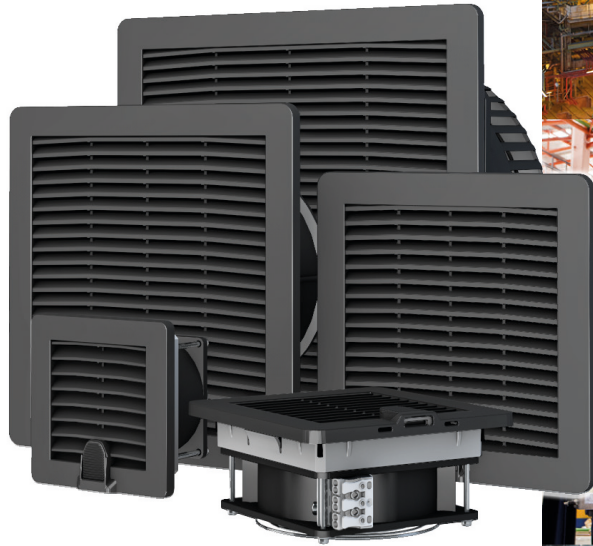
Filterlüfter / Filter Fan Serie D black edition